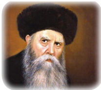
Ребе Йосеф Ицхак Шнеерсон (РАЯЦ, 1880 – 1950)

поскольку этот неожиданный визит не предвещал ничего хорошего. Однако сам Ребе, похоже, не придавал этому никакого значения. Напротив, он велел никому не двигаться с места, и главное, не прерывать веселье, заметив, что сейчас, в самый разгар праздника Пурим, бояться нечего.