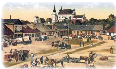
Город Бердичев в 19 веке

* «Да не будет квасного ( хамец ) в жилищах ваших все семь дней праздника» («Шмот», 12:19)