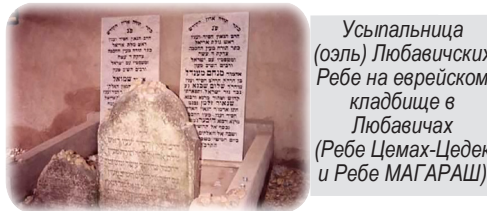
Усыпальница (озль) Любавичских Ребе на еврейском кладбище в Любавичах (Ребе Цемах-Цедек и Ребе МАГАРАШ)

Хотя в самом высказывании (в оригинале – на идише) слово «препятствие» отсутствует, но очевидно, что оно подразумевается. Согласно Ребе МАГАРАШ, наличие препятствия само по себе уже является прямым вызовом нам, но только в том случае,