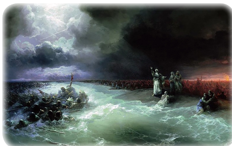
И. Айвазовский “Переход евреев через Красное море”

Интересно, что если в начале Моше было трудно убедить евреев двигаться вперед, по сути – прямо в воду*, то уже в конце, когда мы были спасены, а армия Фараона потонула, народ опять трудно было оторвать от добычи и заставить двигаться вперед – теперь уже к горе Синай и получению Торы.