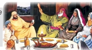
Пасхальное застолье (седер) в древние времена

Как ни странно, но в одном президент Франции Макрон (тоже пострадавший от бесконечных митингов и протестов) оказался прав: власть толпы не может быть выше законной власти, избранной, по сути, той же «толпой». И требования майданов, зачастую, спекулятивные и невыполнимые – это вовсе не «глас народа», а скорее тех манипуляторов и кукловодов, которые всегда стоят за спиной беснующейся толпой. Считается, что всевозможные «майданы» и «цветные революции» – это разновидность