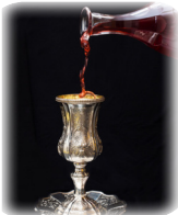
"Бокал пророка Элиягу" (кос-шель-элиягу) в конце Седера