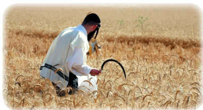
Традиционная жатва пшеницы для выпечки мацы-шмуры

Эта русская идиома очень точно передает характер прихода нашего Избавителя. Как известно, Мошиах придет неожиданно, причем даже для тех, кто ожидает этого каждый день. Тем более что он может явиться к нам в любой момент. И все же есть особое время в еврейском календаре: это месяц Нисан, а еще точнее – праздник Песах, когда его приход особенно ожидаем и вероятен. Поэтому законы и обычаи праздника помогают нам понять, что от нас требуется, чтобы Мошиах пришел уже сегодня. Вот одна из таких историй.