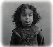
Ребе в детстве (родился 11 Нисана 1902)