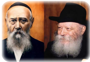
Отец и сын