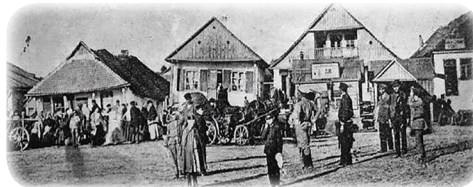
Ружин времен Ружинера Ребе (19 век)

В дальнейшем праведник действительно был заключен в киевскую тюрьму, но потом ему удалось бежать и покинуть