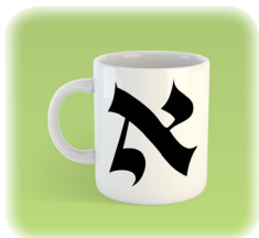
Буква "алеф" в том виде, как она пишется в свитке Торы