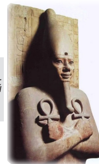
В руках у Фараона т.н. «египетский крест» или «анх»

В будущем, которое уже не за горами, в мире просто не останется «нечистых» мест, а весь этот мир станет «обителью» для Творца (дира-ба-тахтоним) – с приходом Мошиаха, который принесет нам «новое Учение», – скоро, уже в эти дни!