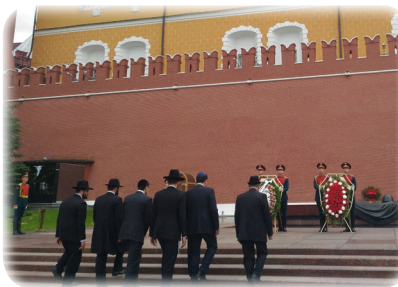
Делегация раввинов во время торжественного возложения венков у могилы Неизвестного солдата

Когда мы отмечаем 9 мая «по-еврейски», мы видим в этом, прежде всего, нашу собственную боль и нашу победу: ведь для