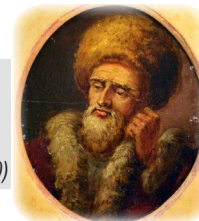
р. Исроэль Фридман, Ружинер Ребе (1796 – 1850)

Согласно предсказанию Любавичского Ребе, наше поколение – это последние поколение Изгнания (галут), и ему же предстоит стать первым поколением Избавления (геула). «Немедленное раскаяние – немедленное Избавление!» (Ребе РАЯЦ)