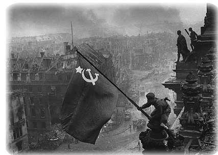
Символ Победы: Красное знамя над Рейхстагом

Евгений Халдей 2 , а о капитуляции гитлеровской Германии сообщил на всю страну голос другого, не менее легендарного, еврея – диктора Юрия Левитана 3 . Это и есть «наша» победа!