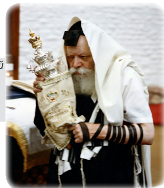
Любавичский Ребе со «своим» свитком Торы

насчитывается 613 (причем, строго говоря, Десять заповедей входят в общее число 613) 1 .