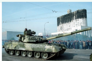
Характерная картина того дня: танк на фоне обгоревшего Белого дома

Посланники в Москве в замешательстве. Здесь происходит государственный переворот! Коммунисты хотят снова вернуть себе власть! Может быть, в такой ситуации нам следует срочно покинуть Россию?