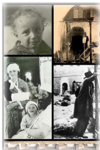
Начало арабо-израильского конфликта: жертвы еврейской погромы в Хевроне (1929)

Но вернемся к суровым и трагическим реалиям нашей действительности.