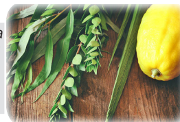
Четыре вида ритуальных растений (арбаат-га-миним)