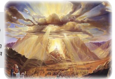
Дарование Торы на горе Синай (6 Сивана, 2448 год от Сотворения мира)

связанный с наличием свободы выбора, все же оставался до последнего момента.