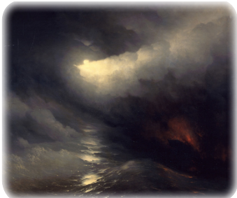
«Сотворение мира» (И. Айвазовский, 1864)

«И было завершено творение небес и земли, и всего их воинство» (2:1)