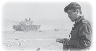
«Эти полагают-ся на колесницы, а те – на коней, а мы – имя Г-спода Б-га нашего славим» (20:8)

По сути, сегодня Израиль начал свою СВО – спецоперацию, цель которой та же: разоружить весь взрывоопасный регион – Сектор Газа (почти «Правый сектор»), обезопасить своих граждан и уничтожить террористов в их логове. При этом Израиль стал применять достаточно жесткие меры. В результате, для многих Израиль в мгновение ока стал второй Россией: «оккупантом», который применяет «незаконные методы» ведения войны.